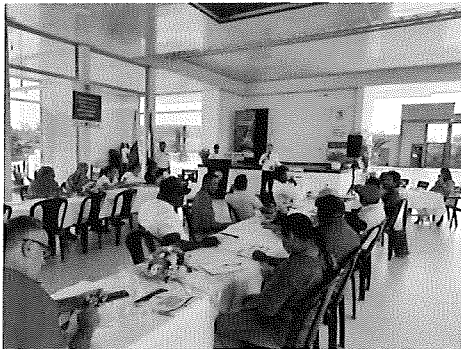
Imagen 1. Evento de socialización del proyecto con Los rectores y coordinadores de las I.E.O. beneficiarias.

A continuación, se relacionan algunas fotografías que evidencian las actividades de socialización llevadas a cabo en el marco del proyecto.