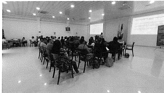
Imagen 3. Evento socialización docentes municipio San José del Guaviare.